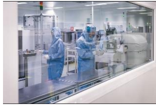
Elektronik und Mechatronik sind wichtige Wachstumsfelder von MAHLE – im Bild: Produktion von Elektronikkomponenten in Mottilla, Spanien.